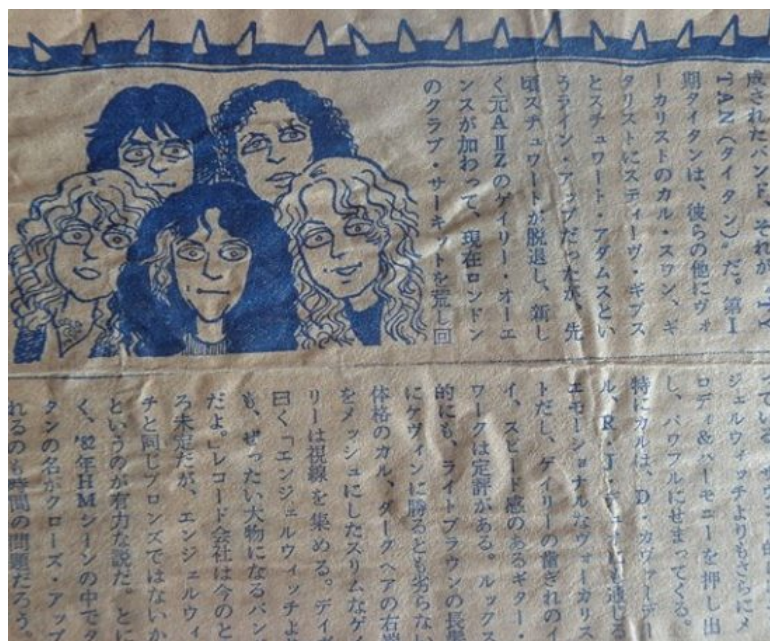
Un aficionado de Japón me envió esta caricatura