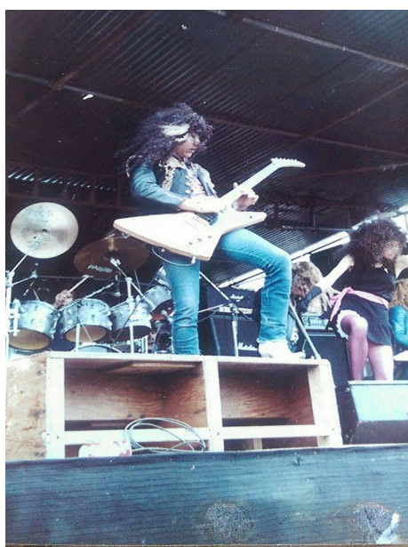
Monmore Football Stadium

La banda comenzó a obtener una reputación internacional de los conciertos de Londres como la mayoría de los medios de comunicación rock del mundo vería bandas en la marquesina. Pasamos a hacer muchos otros conciertos, y empezamos a buscar el apoyo de una gran gira con bandas establecidas.